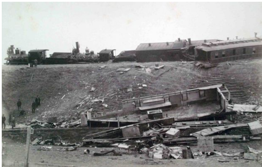
фотография А.М. Иванецкого

Задание 12. (ответ на данное задание оценивается в рамках Олимпиады школьников «В мир права» и одновременно в рамках Конкурса олимпиадных работ школьников на призы Следственного комитета Российской Федерации)